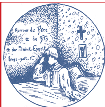
3- Le premier geste