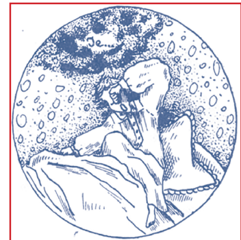
2- "Quel sommeil ! Mais je ne veux pas être paresseux !"