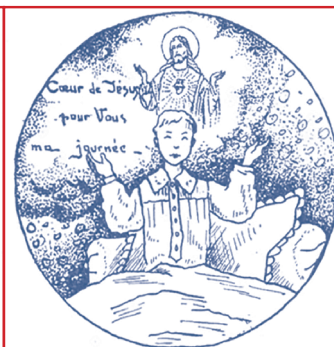
4- L'offrande de la journée