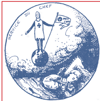
1- Le rêve du Croisé

S ainte Maria Goretti avait compris combien le péché offense Dieu et elle voulait L'aimer de tout son cœur. Pour cela, elle faisait extrêmement attention à éviter tout ce qui pouvait Lui déplaire et elle avait une grande horreur du péché, si bien qu'un jour, parlant avec sa maman des mauvaises conversations qu'elle avait entendues, elle lui dit : "Oh Maman, je préférerais mourir, plutôt que de répéter ces mots très laids, parce qu'ils offensent le Bon Dieu !" Ces paroles n'étaient pas du vent, mais elles montraient la détermination de sa volonté : elle mourut plutôt que de commettre un péché !